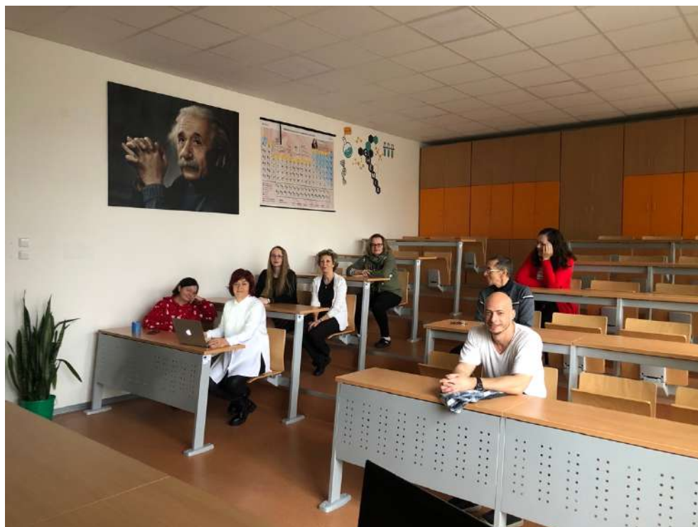
Fotky z pedagogického klubu „Úspěšný absolvent přírodovědných predmetov“ (3.10.2022)