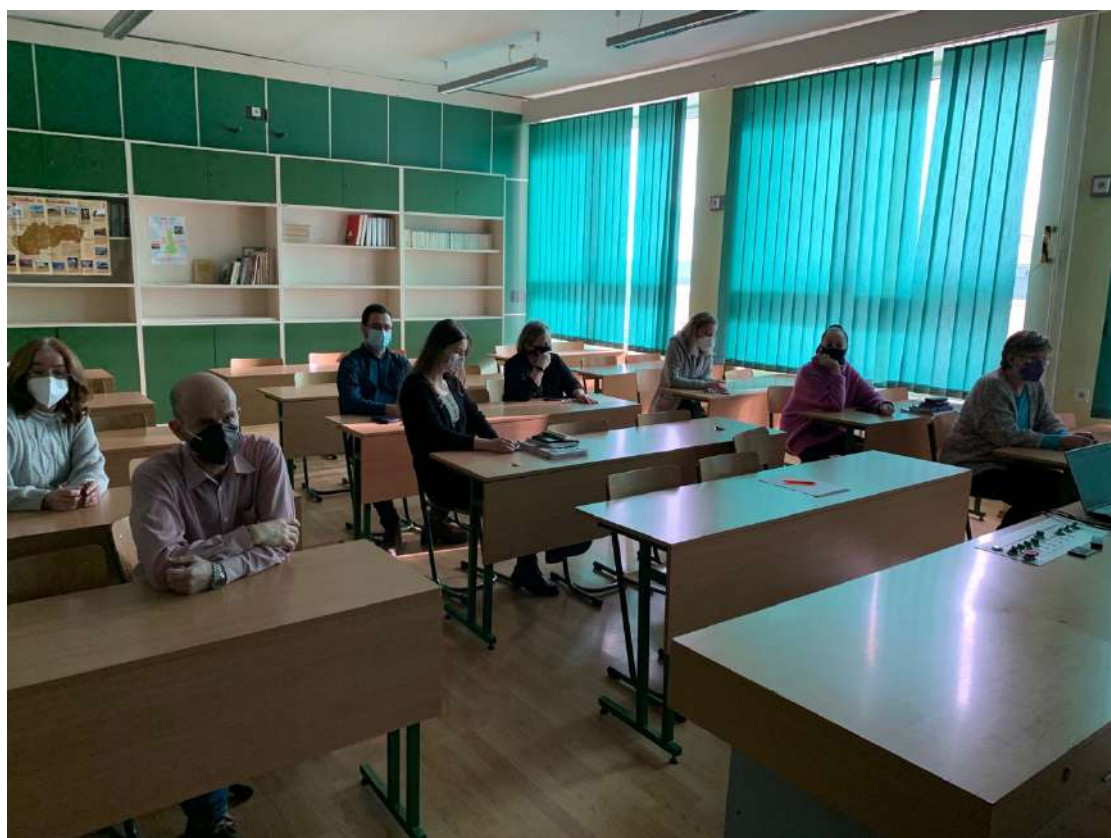
Fotky z pedagogického klubu „Úspešný absolvent humanitných predmetov“ (8.2.2022)