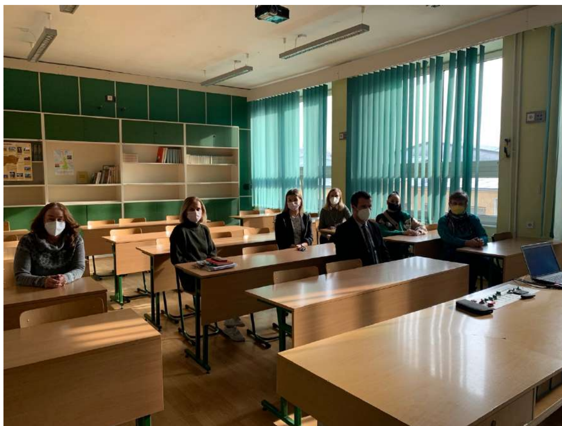
Fotky z pedagogického klubu „Úspešný absolvent humanitných predmetov“ (1.2.2022)