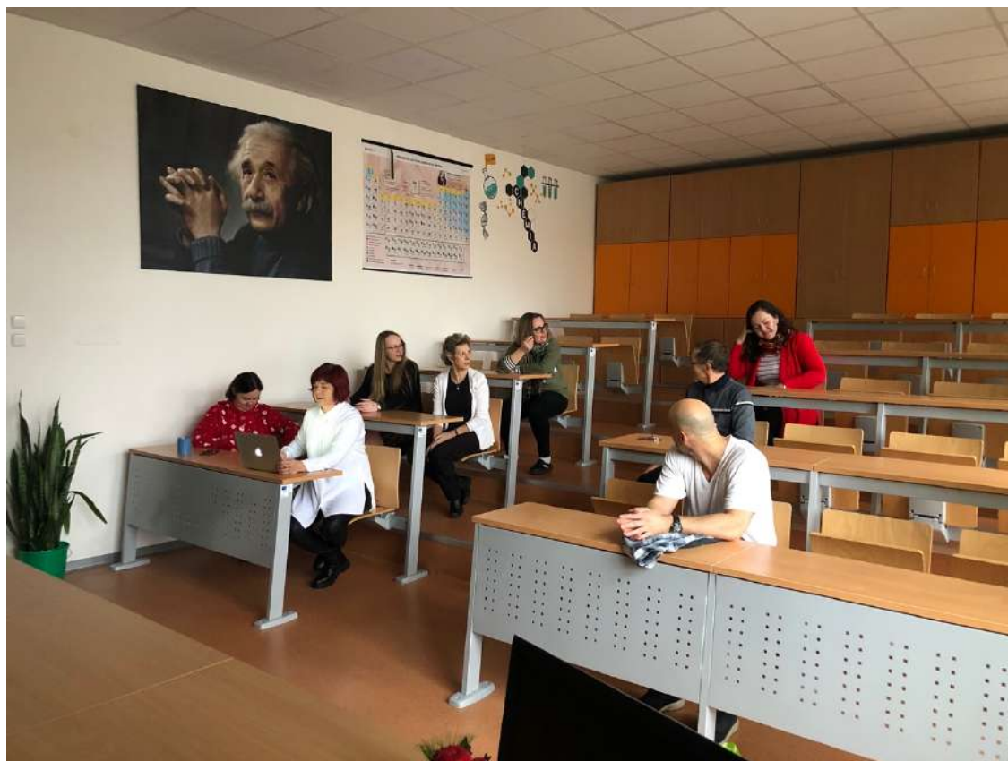
Fotky z pedagogického klubu „Úspěšný absolvent přírodovědných predmetov“ (5.12.2022)