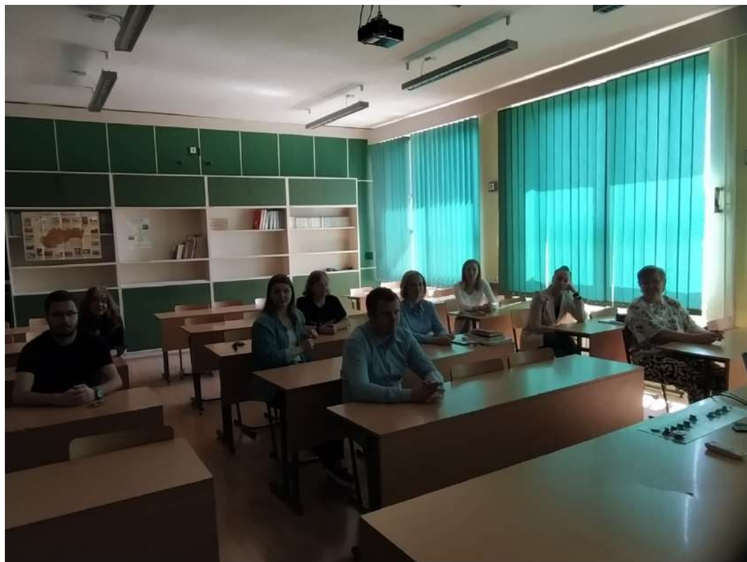
Fotky z pedagogického klubu „Úspešný absolvent humanitných predmetov“ (17.3.2022) - jeden člen klubu zhotovoval fotku