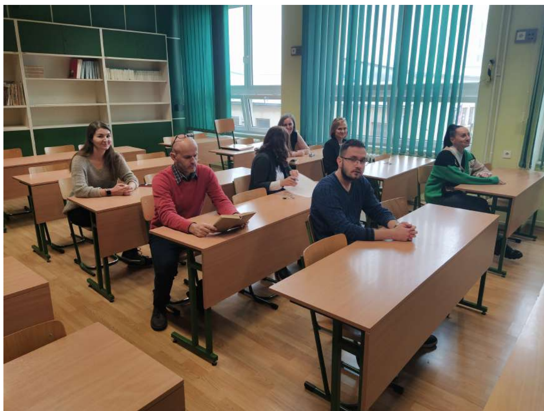
Fotky z pedagogického klubu „Úspešný absolvent humanitných predmetov“ (29.11.2022)