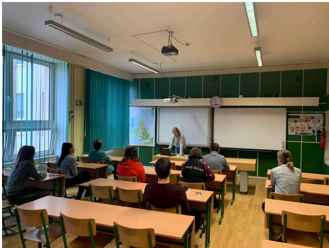
Fotky z pedagogického klubu „Úspešný absolvent humanitných predmetov“ (15.11.2022) - 1 člen klubu fotil