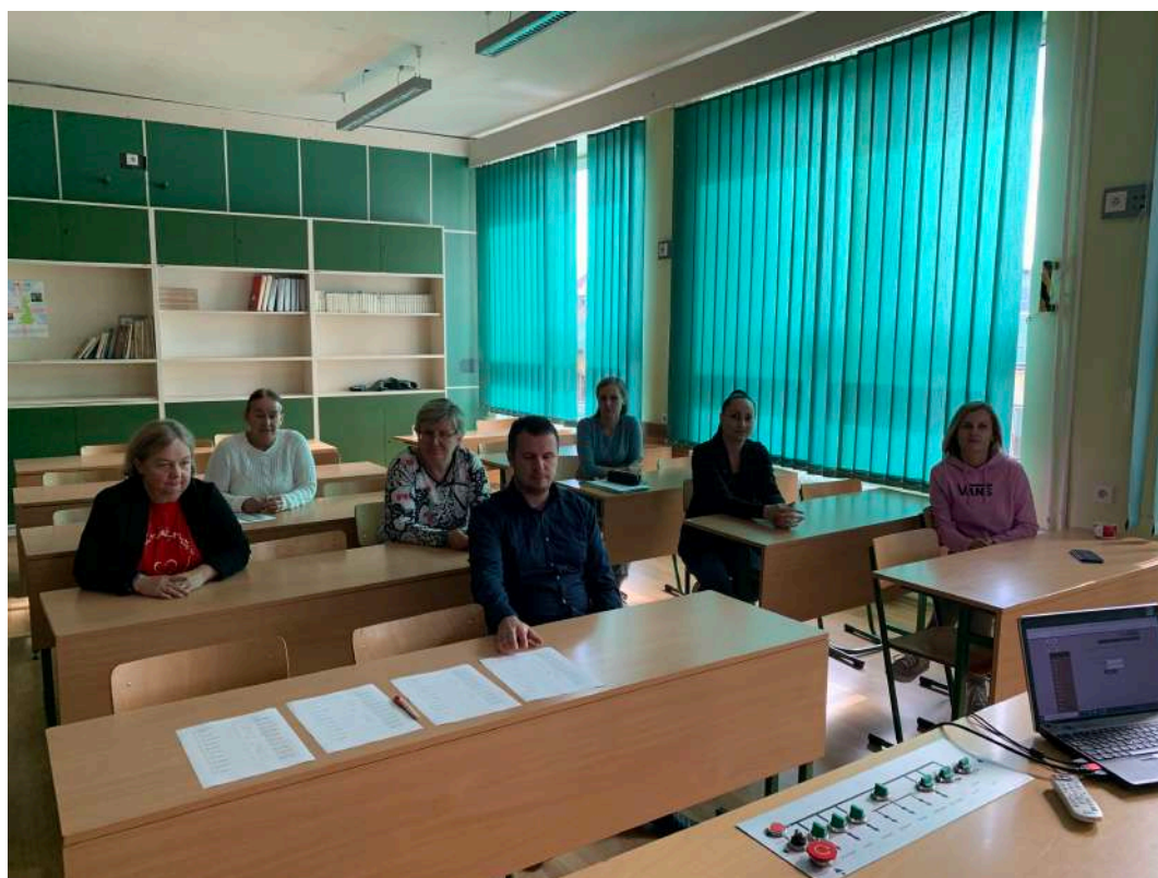
Fotky z pedagogického klubu „Úspešný absolvent humanitných predmetov“ (27.9.2022)